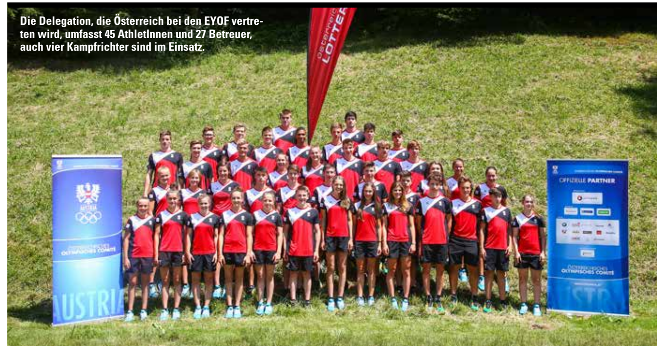
Die Delegation, die Österreich bei den EYOF vertreten wird, umfasst 45 AthletInnen und 27 Betreuer, auch vier Kampfrichter sind im Einsatz.

Österreich entsendet 45 AthletInnen zum EYOF nach Tiflis. Beim Kick-off-Event in Abtenau wurde der Nachwuchs eingestimmt.