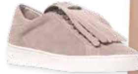
Michael Kors € 145,-