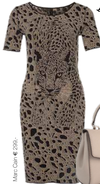
Marc Cain € 299,-

ROMANTISCHE MODE UND VIELLEICHT EIN BISSCHEN FRIEDLICHER PROTEST - DAS GEHT BEI MARC CAIN ZUSAMMEN. ERSETZT AUF VERSPIELTE SCHNITTE, LUF TIGE STOFFE, GANZ VIEL PASTELL UND UNSCHULDIGES WEISS. HOSEN MIT WEITEM BEIN, BLUSEN MIT ZARTEM ANIMAL-CAMOUFLAGE-DRUCK ODER DOUBLEFACE-MÄNTEL SIND DIE KEY PIECES. IM KONTRAST DAZU BEGEISTERN FLAUSCHIGE QUALITÄTEN UND FLEO-MUSTER, EIN MIX AUS FLOWERS UND LEO.