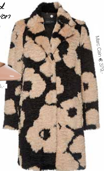
Marc Cain € 379,-

Marc Cain - neu im Modehaus Adelsberger und viele aktuelle Trends in jeder Preisklasse. www.adelsberger.at