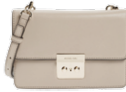
Michael Kors € 145,-