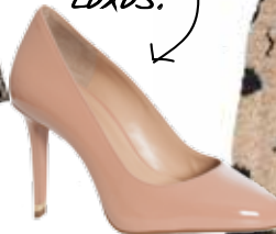
Michael Kors € 145,-