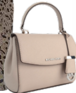
Michael Kors € 325,-