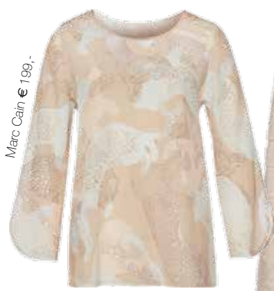
Marc Cain € 199,-