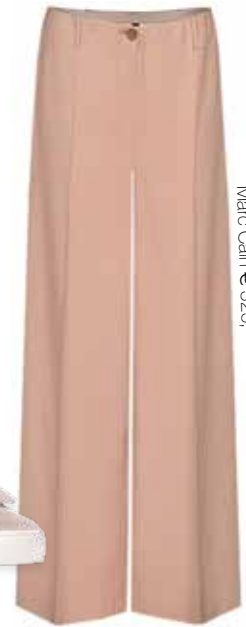
Marc Cain € 325,-