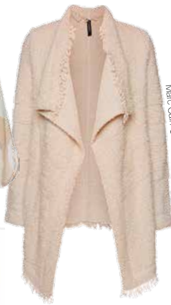
Marc Cain € 349,-